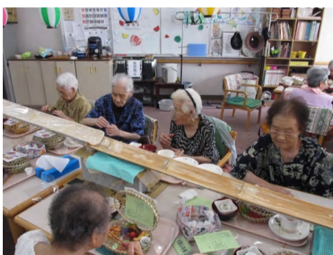
△夏はやっぱり流しソーメンです！