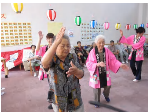
△昔を思い出して踊って頂きました

職員一同心よりお待ちしております。よろしくお願ひ致します。 ※利用料金や申し込み方法等、ご不明な点はお気軽にお電話下さい。(33-4567 社協デイサービスまで)